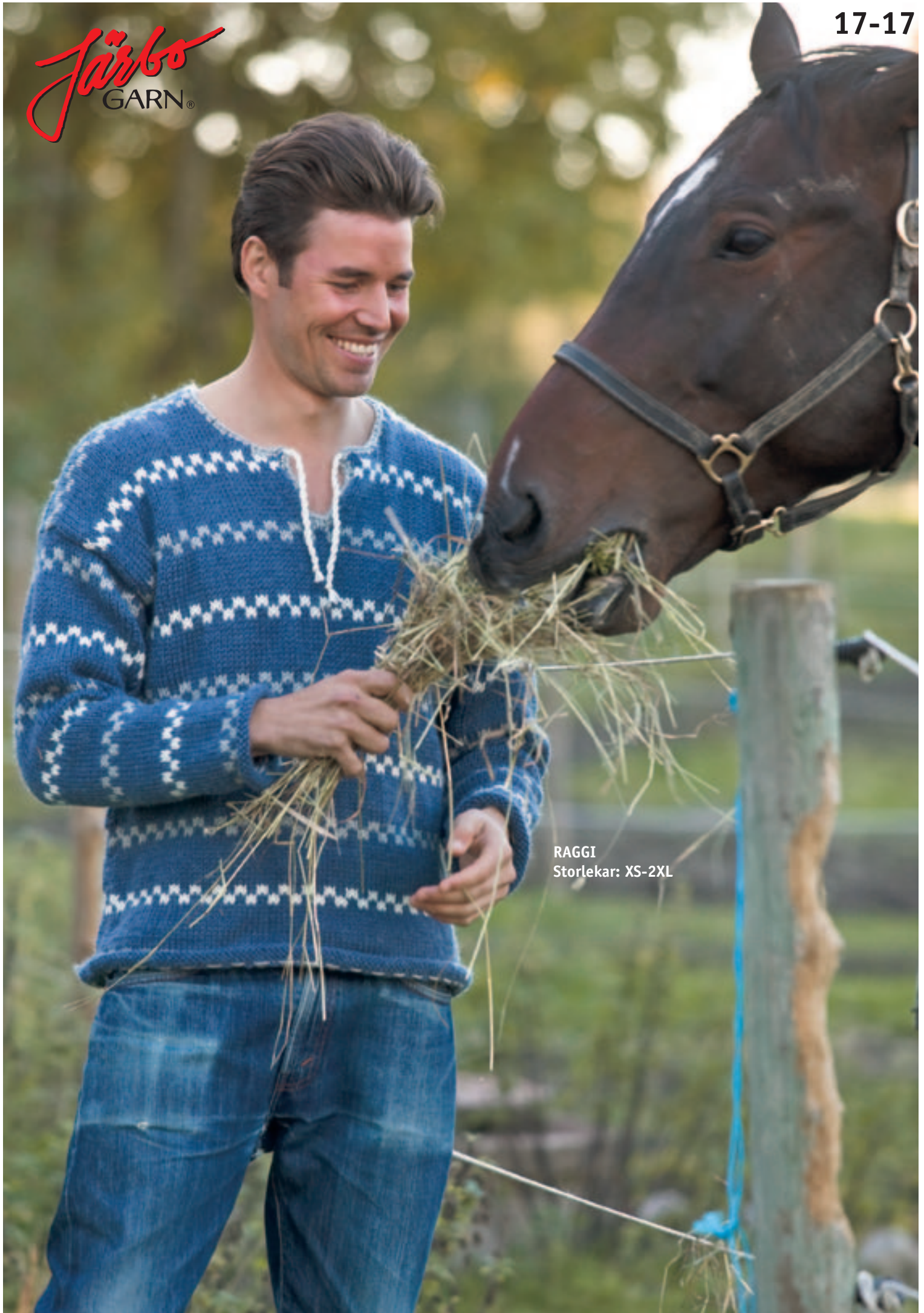
RAGGI Storlekar: XS-2XL