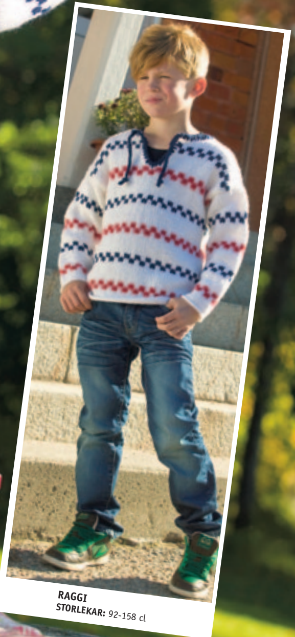
RAGGI STORLEKAR: 92-158 cl