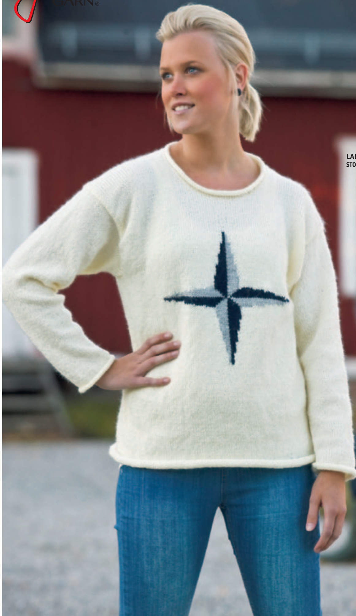
LADY ALT FUGA STORLEKAR: XS-2XL